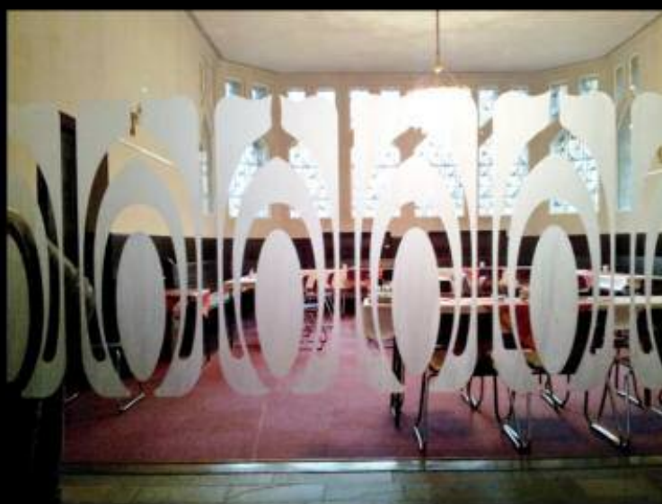
Frieblem als Glasätzung