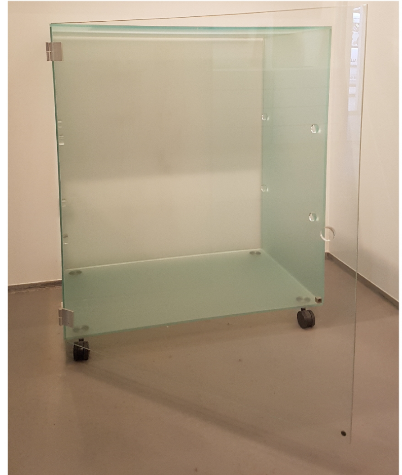
hochtransparente UV-Verklebung Glas-Glas und Glas-Edelstahl