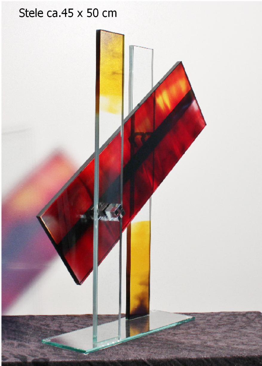
Stele ca.45 x 50 cm