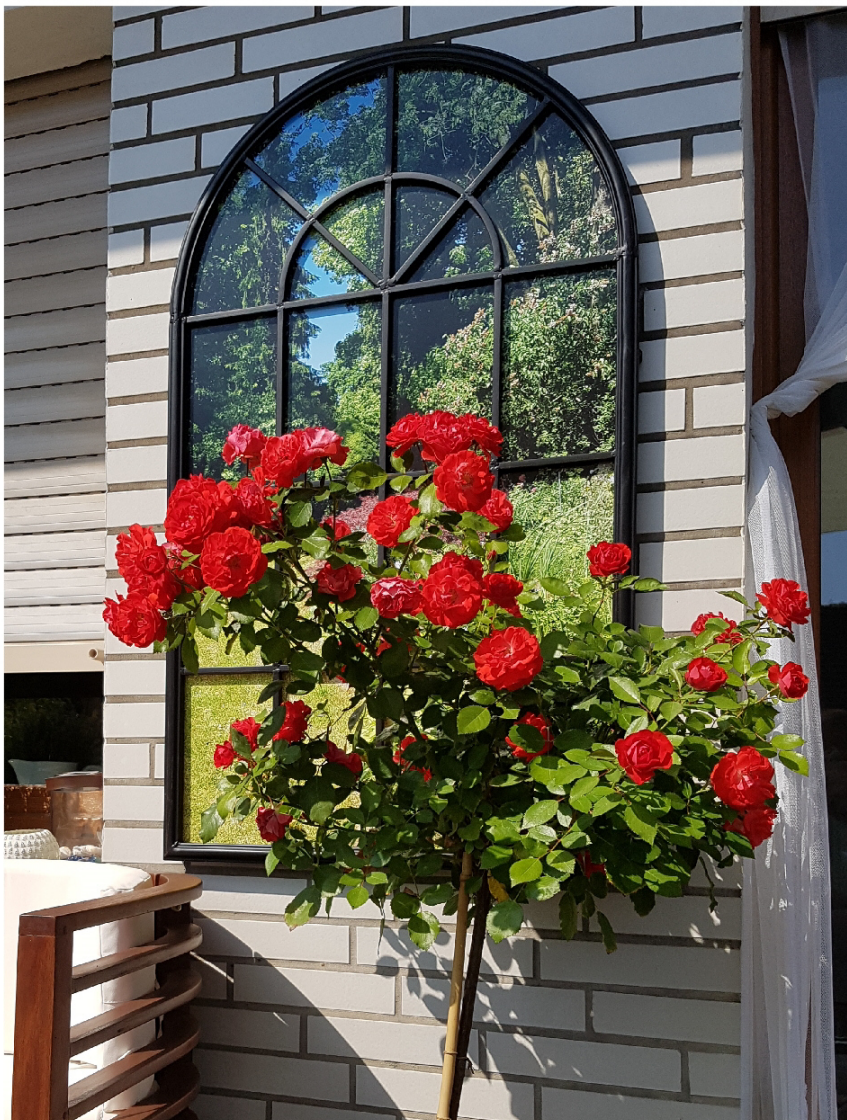
Fotofolie auf Floatglas