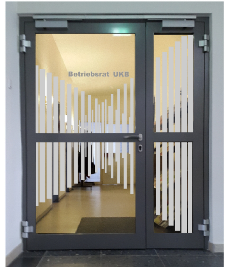
Dekofolie auf Brandschutzglas