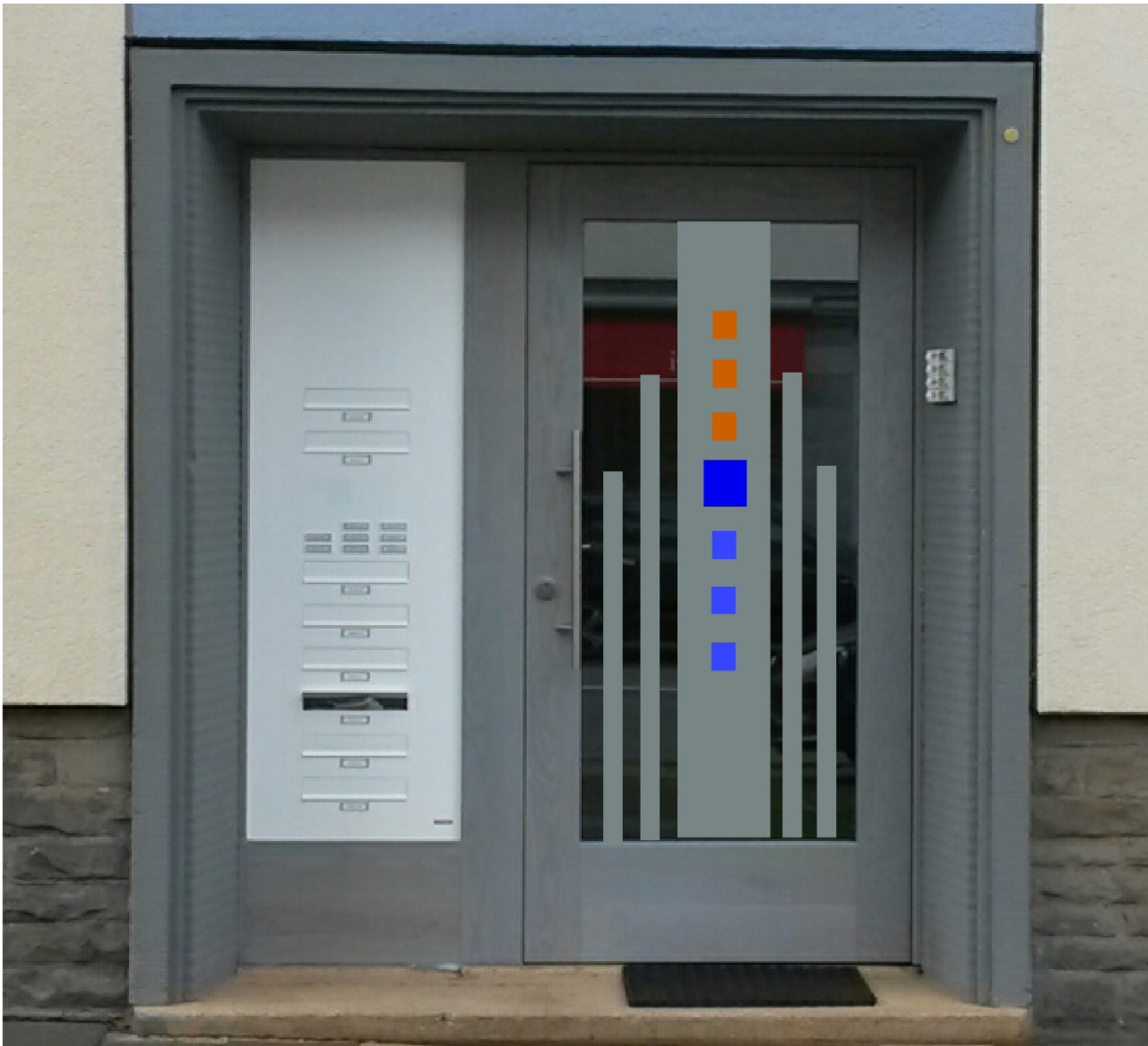
Dekofolie auf Verbundsicherheitsglas